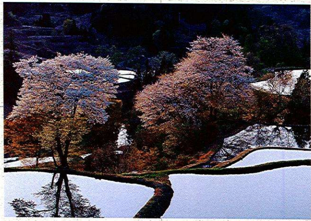
② 儀明(ぎみょう)の棚田(松代地域)