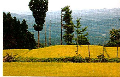
⑫ 湯山(ゆやま)の棚田(松之山地域)