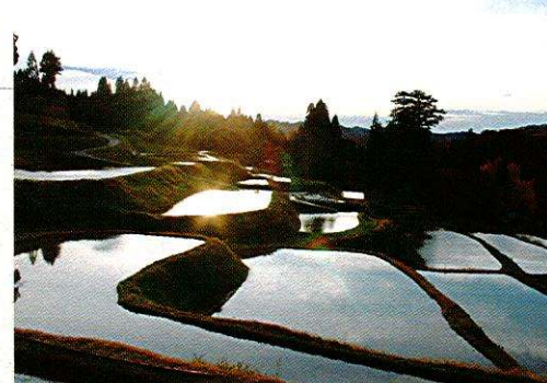
⑱ 藤沢(ふじさわ)の棚田(川西地域)