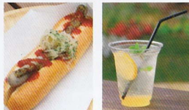
ハニーマスタードのホットドッグ はちみつレモンソーダ