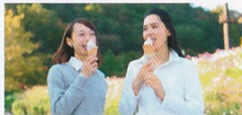
ラベンダーソフトクリーム