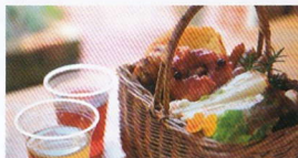
ガーデンランチセット